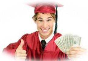
СХЕМА “МЛАДЕЖКА ЗАЕТОСТ”

Оперативна програма “Развитие на човешките ресурси”